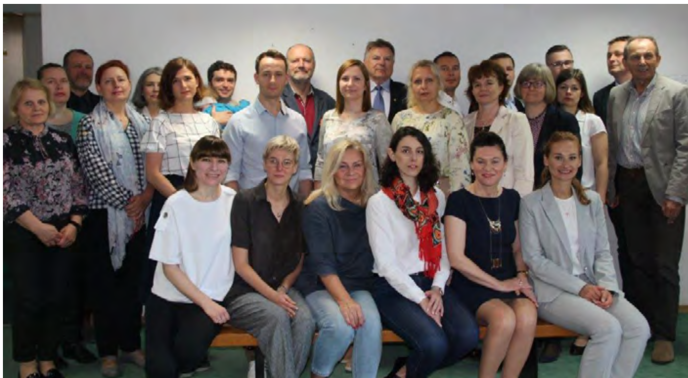
Pracownicy Katedry Nauk Humanistycznych i Społecznych 2019 r.