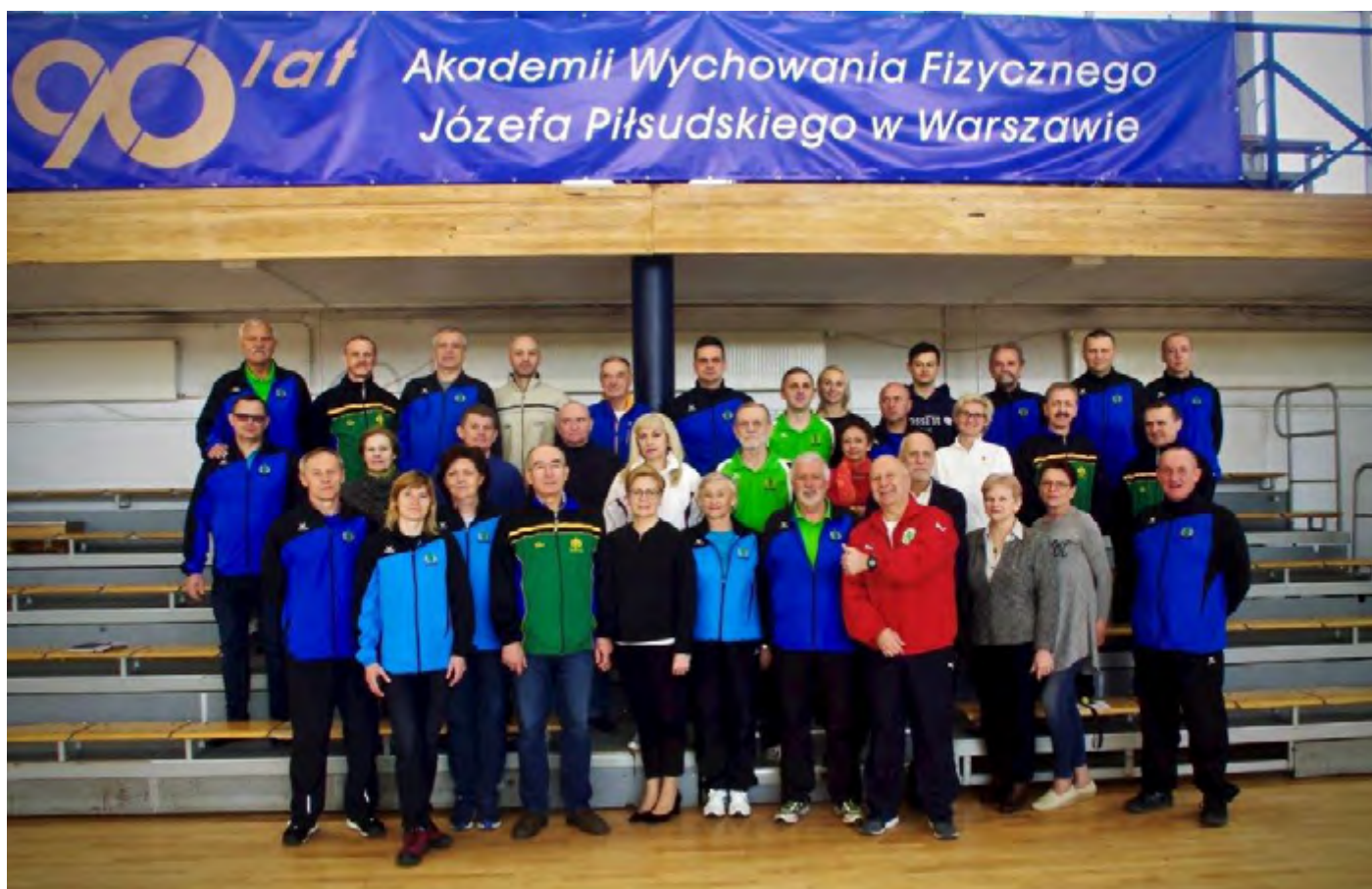
Pracownicy Katedry Sportu 2019 r.

Katedra Sportu (kier. dr hab. Marek Kruszewski) i cztery zakłady.