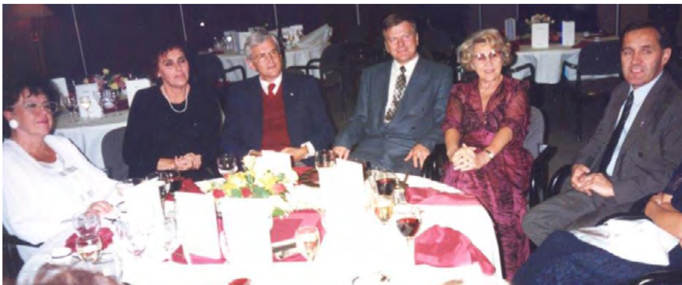
II European Congres of Fair Play, Warszawa, wrzesień 1996 r. Współorganizator Zakład Pedagogiki.