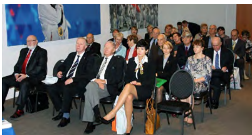
XI Ogólnopolska Konferencja Naukowa z udziałem gości zagranicznych pt. Społeczno-edukacyjne oblicza współczesnego sportu i olimpizmu , PKOl, 2015 r.