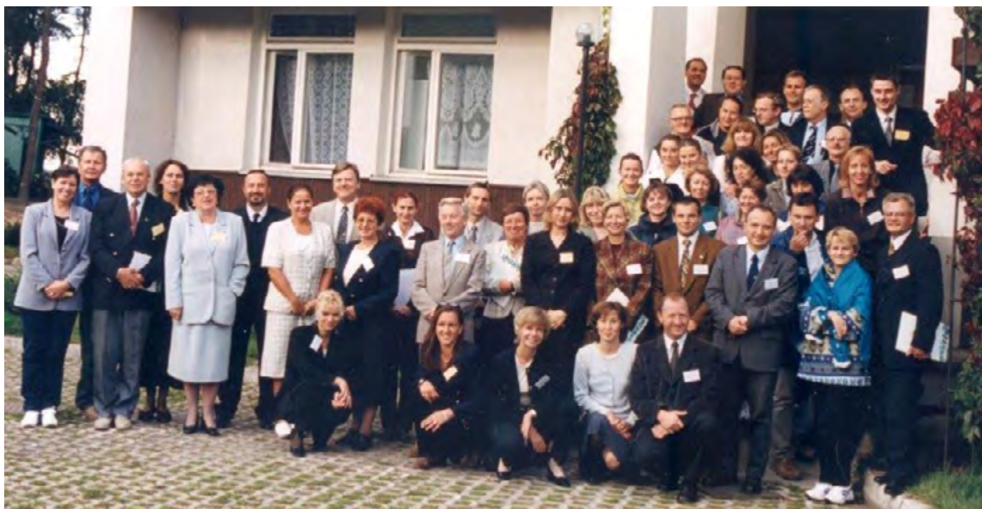
Sumposium Ogólnopolskie Edukacja olimpijska w reformującej się szkole, Zorganizowane przez Zakład Pedagogiki, Piekna Góra, wrzesień 2000 r.

W skład struktury wydziału wchodziły: Instytut Sportu z siedmioma zakładami; Instytut Turystyki i Rekreacji z ośmioma zakładami (rozpoczął funkcjonowanie 1.10.1999 r., Zarządzenie Rektora nr 3 99/2000 z dn. 11.11.1999 r.); Katedra Teorii i Metodyki Wychowania Fizycznego z czterema zakładami; Katedra Nauk Humanistycznych z trzema zakładami; Katedra Nauk Społecznych z trzema zakładami; Katedra Anatomii i Biomechaniki z dwoma zakładami; Katedra Biologii i Medycyny z czterema zakładami; Katedra Fizjologii i Biochemii z dwoma zakładami.