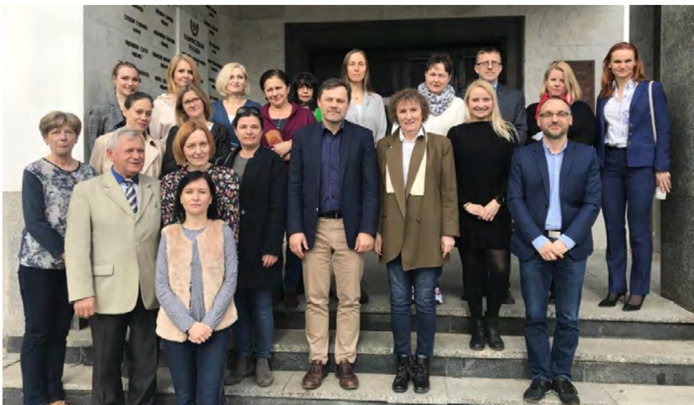
Pracownicy Katedry Nauk Biomedycznych 2019 r.

Nauk Biomedycznych (kier. dr hab. Andrzej Mastalerz prof. AWF) i pięć zakładów;