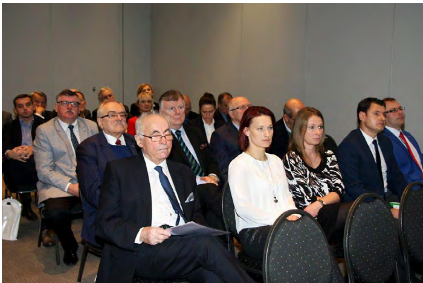
XII Ogólnopolska Konferencja Naukowa z udziałem gości zagranicznych z cyklu Spoleczno-edukacyjne oblicza wspolczesnego sportu i olimpizmu, PKOl, 17.11.2016 r.