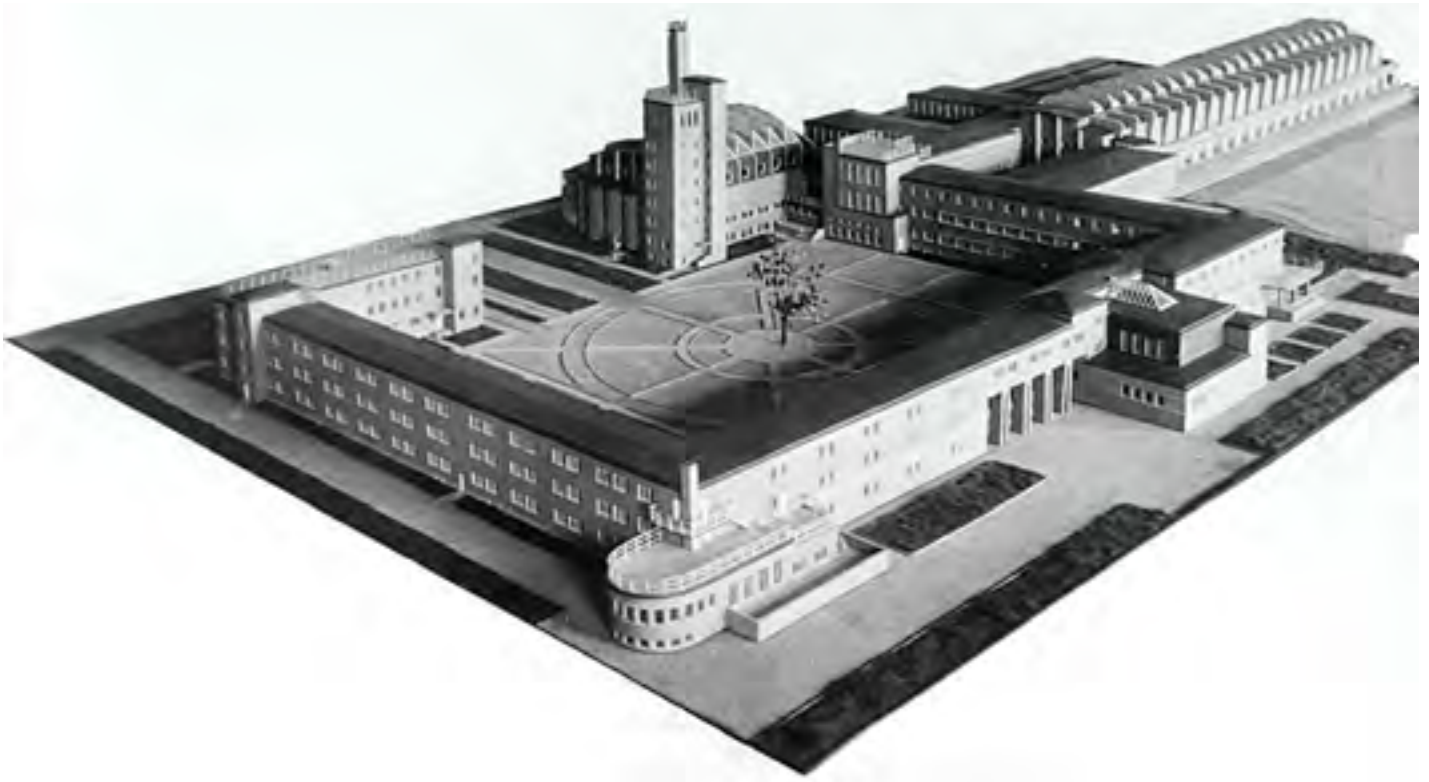
Makieta CIWF - E. Norwerth