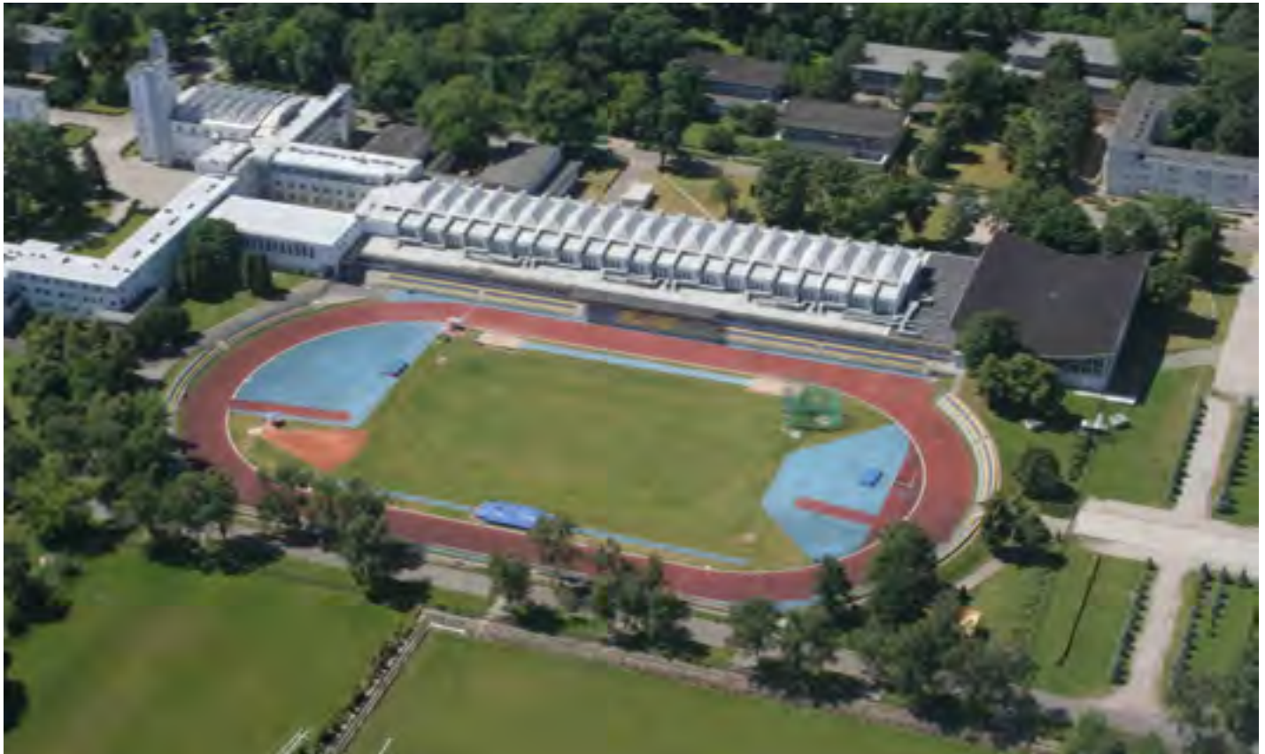
AWF z lotu ptaka

Copyright by Akademia Wychowania Fizycznego Józefa Piłsudskiego w Warszawie. Wszystkie prawa zastrzeżone. Przedruk i reprodukcje w jakiegokolwiek postaci całości lub części bez pisemnej zgody wydawcy zabronione. Opracowane na podstawie oryginalnych tekstów dostarczonych przez Autorów