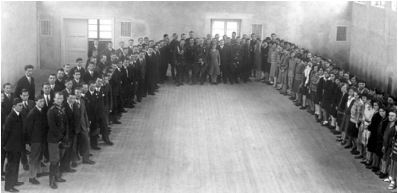
Pierwsza inauguracja roku kademickiego w CIWF w dniu 29 listopada 1929 roku, w sali gimnastycznej ówczesnego internatu żeńskiego (dziś sala gimnastyczna nr 3).