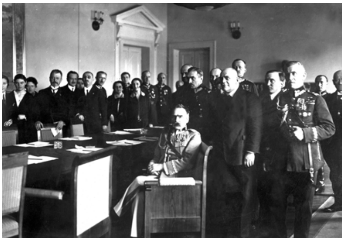
Pierwsze posiedzenie Rady Naukowej Wychowania Fizycznego.