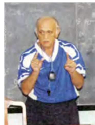
Spotkanie z Andrzejem Strejlauem, jednym z najwybitniejszych trenerów piłki nożnej, 2019