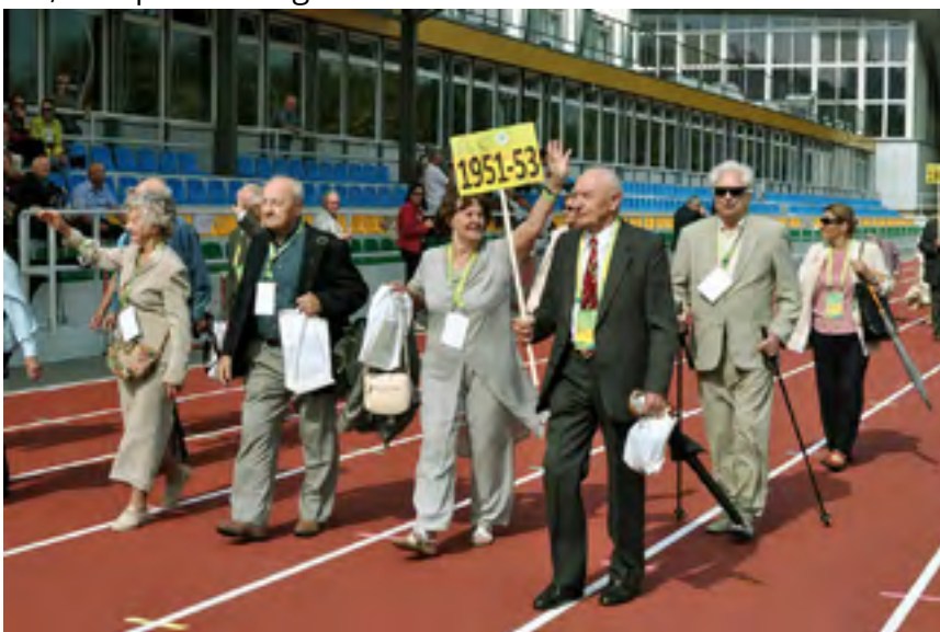
Najstarsze roczniki absolwentów w defiladzie 2015 r