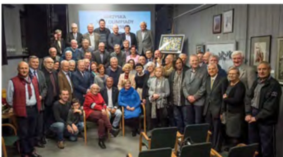
Spotkanie z okazji 30. rocznicy igrzysk olimpijskich XXIV olimpiady w Seulu z udziałem medalistów olimpijskich, trenerów i prezydenta Aleksandra Kwaśniewskiego, grudzień 2018