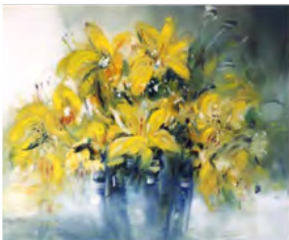
Wystawa malarstwa Alicji Skład, 2019