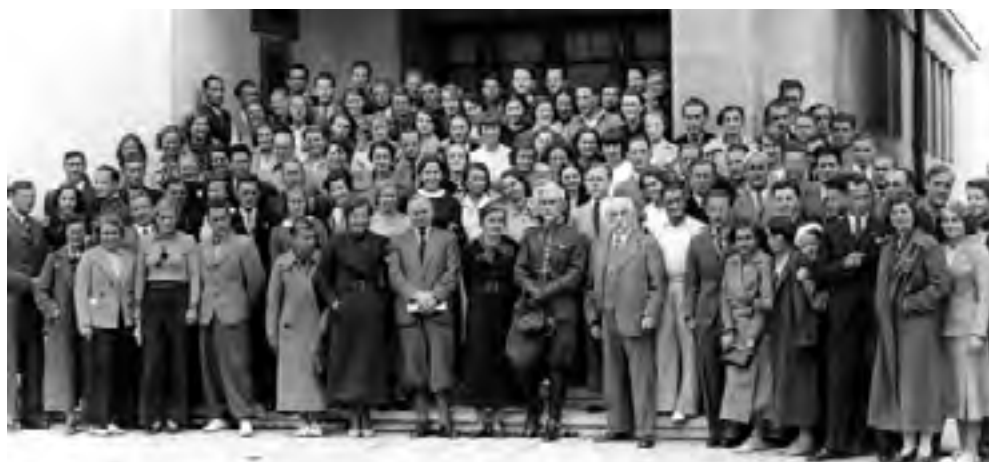
I Zjazd Absolwentów, wrzesień 1935