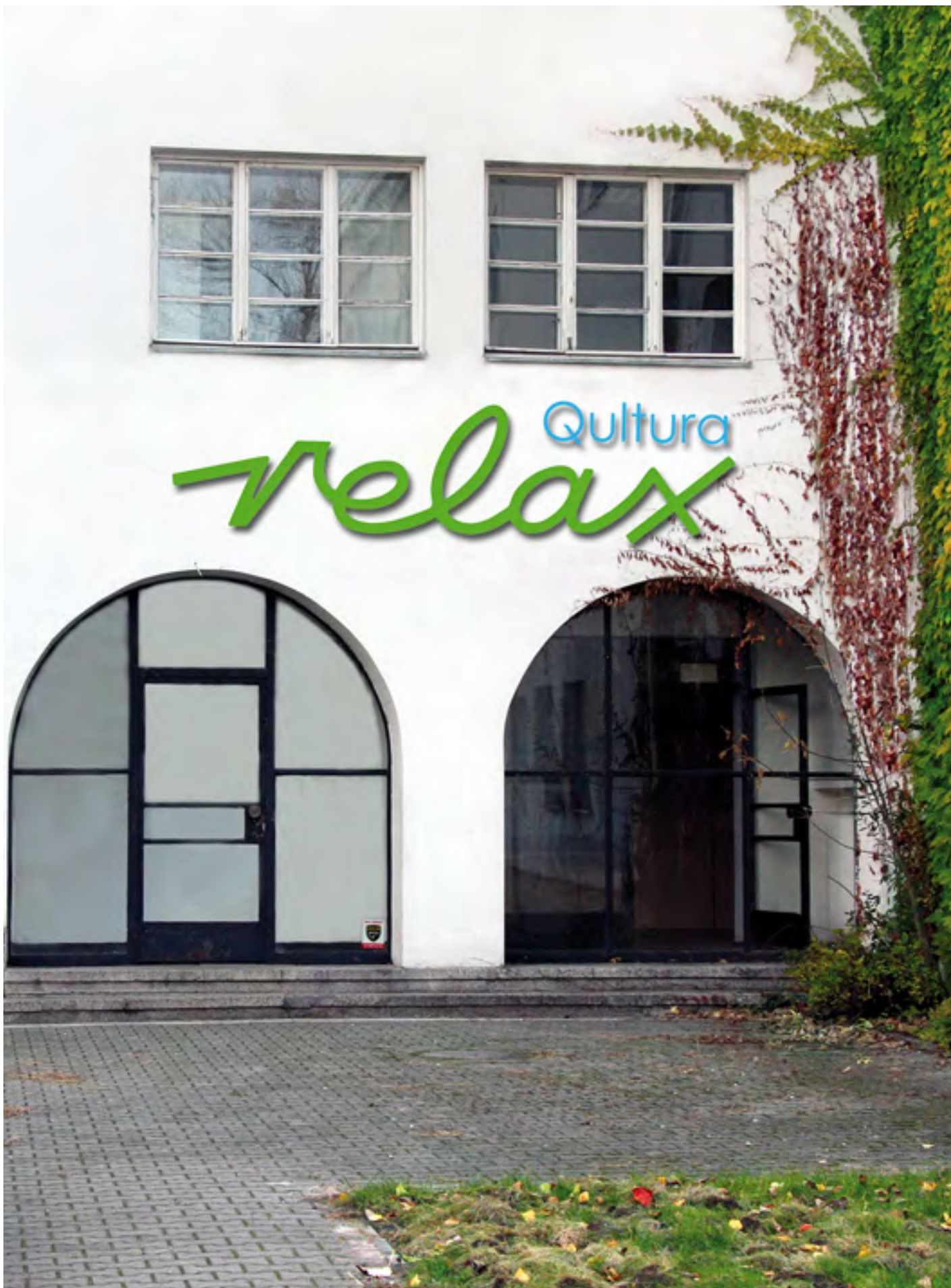
W grudniu 2017 r. reaktywowano klub Relax Qultura