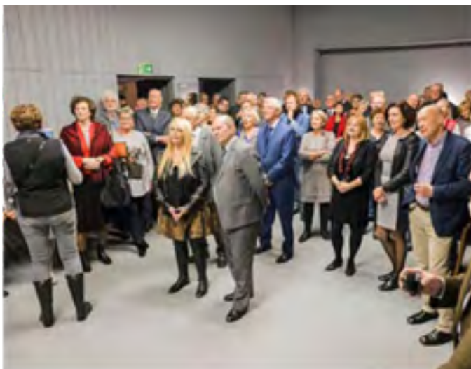
29 listopada 2017 r. nastąpiło otwarcie klubu, w którym uczestniczyła m.in. Maryla Rodowicz rozpoczynając w tym klubie karierę estradową