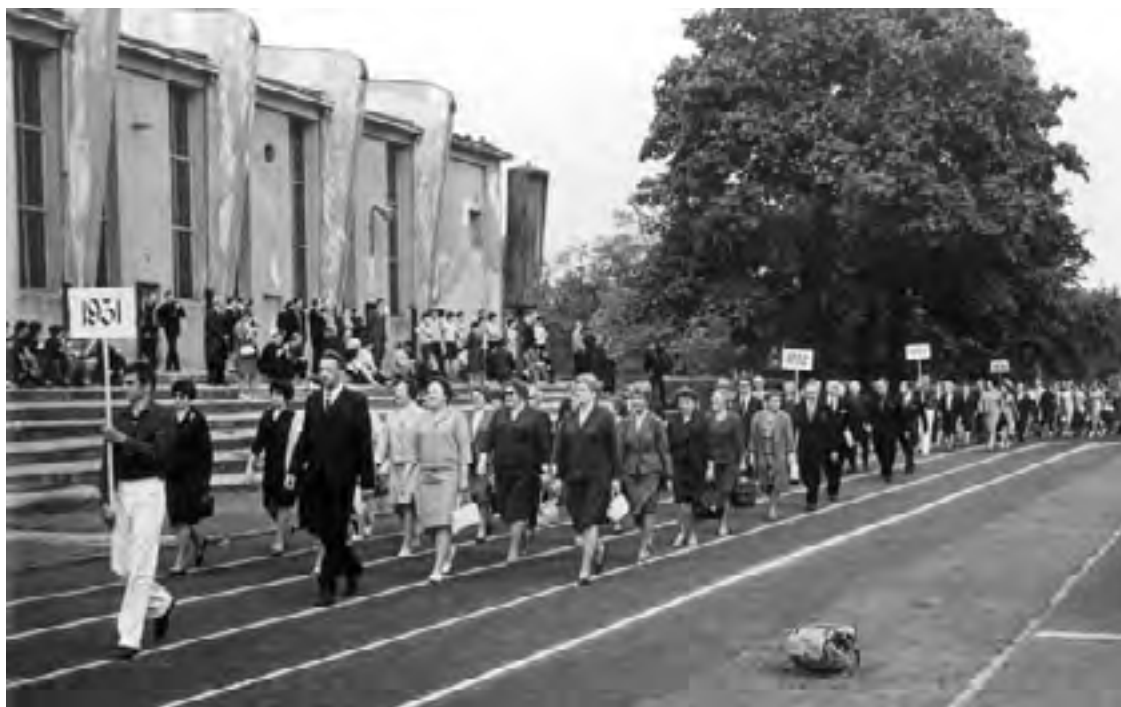
Defilada roczników Zjazdu Absolwentów na 30-lecie AWF, czerwiec 1960

Sukcesem Koła Absolwentów CIWF i Bratniaka, stał się zorganizowany (przy współudziale władz uczelni), pierwszy zjazd absolwentów uczelni w 1935 roku (9-11 września), a także drugi – już siedmiodniowy - w czerwcu 1937 roku. Nie miały one charakteru wyłącznie towarzyskiego. Obydwa zjazdy nasycono bogatym programem szkoleniowym, obfitującym w spotkania dydaktyczne, pokazy i warsztaty metodyczne. Drugi zjazd jest szczególnie ważny z naszego punktu widzenia, bowiem w jego trakcie rozszerzono i wzmocniono formalną rangę Koła Absolwentów CIWF - przekształcając je w Związek Byłych Wychowanków CIWF .