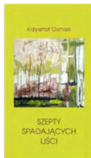
Wieczór poezji Krzysztofa Osmana, 2019