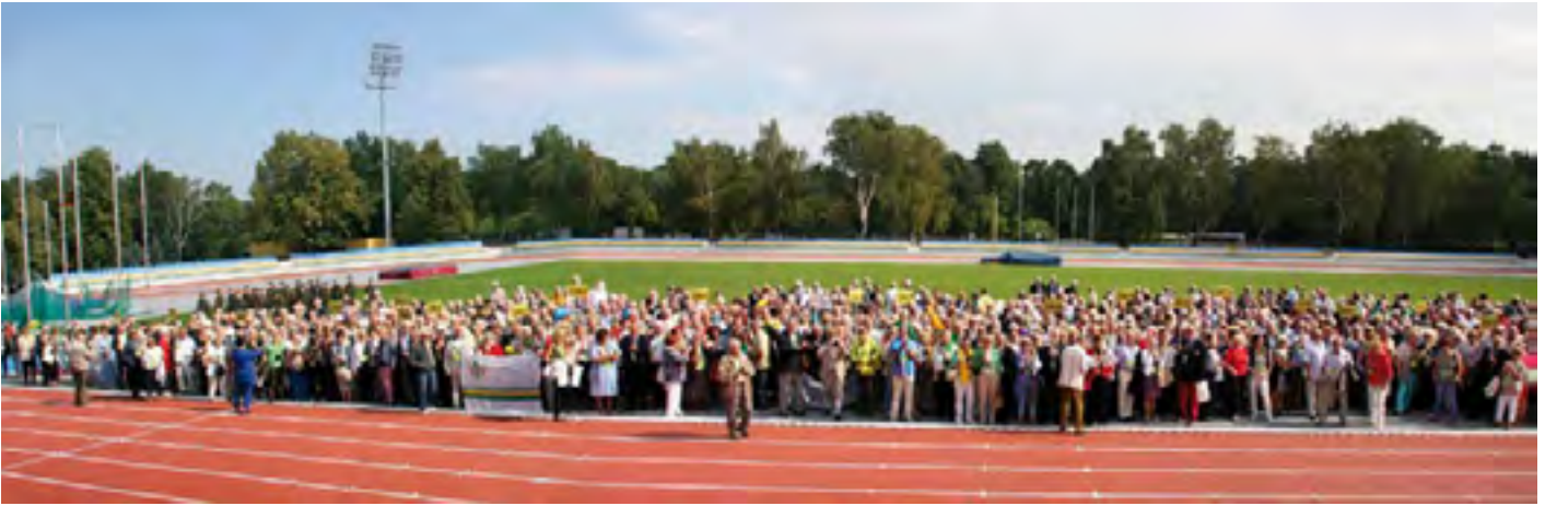
Uczestnicy zjazdu absolwentów 2015 r.

Zorganizowano nadto szereg akcji, których tematem były ważne dla środowiska problemy. Do takich zaliczyć należałoby konferencję Quo Vadis Uczelnio , poświęconą perspektywom związku sportu z uczelnią, a także przekazanie władzom państwowym i sportowym Listu Otwartego w sprawie wpływu tzw. ustawy deregulacyjnej na wykonywanie zawodu trenera i instruktora (List opublikowano również w numerze 1/2012 naszego kwartalnika).